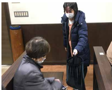
▲献金はカゴを回さず、担当者が回って集めました。