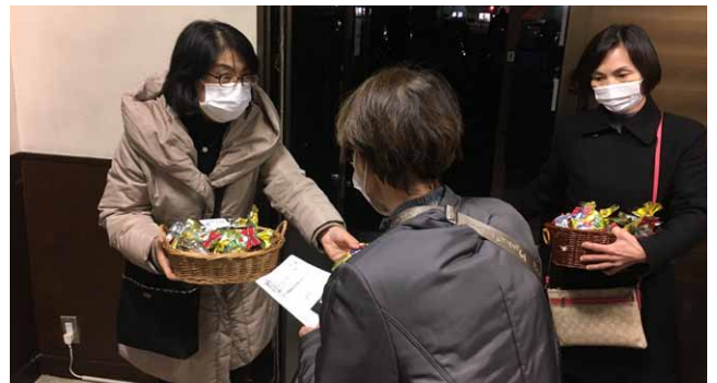
▲帰るときに、出口でプチプレゼントが配られました。