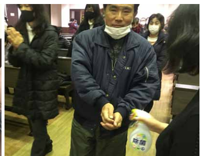
▲聖体拝領の直前に、両手をアルコール消毒。