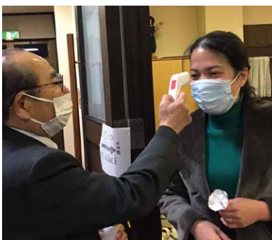
▲入堂前には記名、検温、アルコール消毒を行いました。