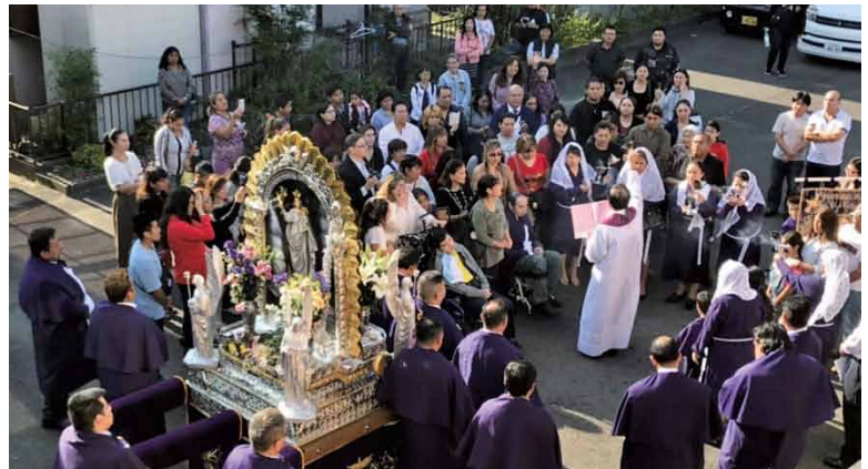
▲神輿の前で踊りを捧げ、神輿を囲むように人々が集まり、神父様から祝福を受けました。