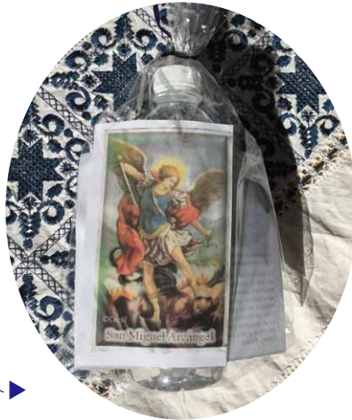
ご聖水が入ったボトルと御絵のセット▶

紫の服に身を包んだ人たちがキリストの壁画を模した神輿を担ぎ、駐車場内をぐるりと一周します。こどもたち、病気の人たち、列席したみんなが祝福を受けたあと、聖堂へ移動してミサがはじまりました。最後に、祝福されたご聖水をいただき、今年のペルー祭は終わりました。