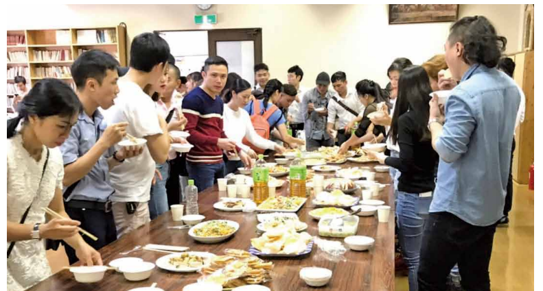
▲ミサ後、ホールでのパーティの様子。食事と歌と踊りで盛り上がりました!