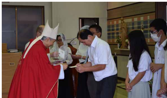
受聖者のみなさんには 司教様からお祝いのカード 教会から記念品 & 花束が 贈られました。