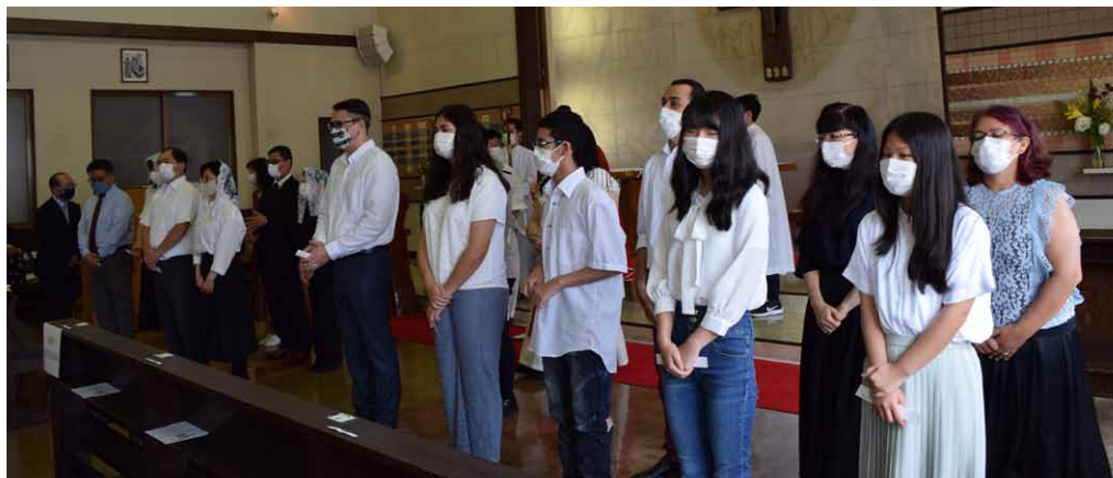
▲ 堅信の秘跡を受けた皆さんと 代父・代母の皆さん