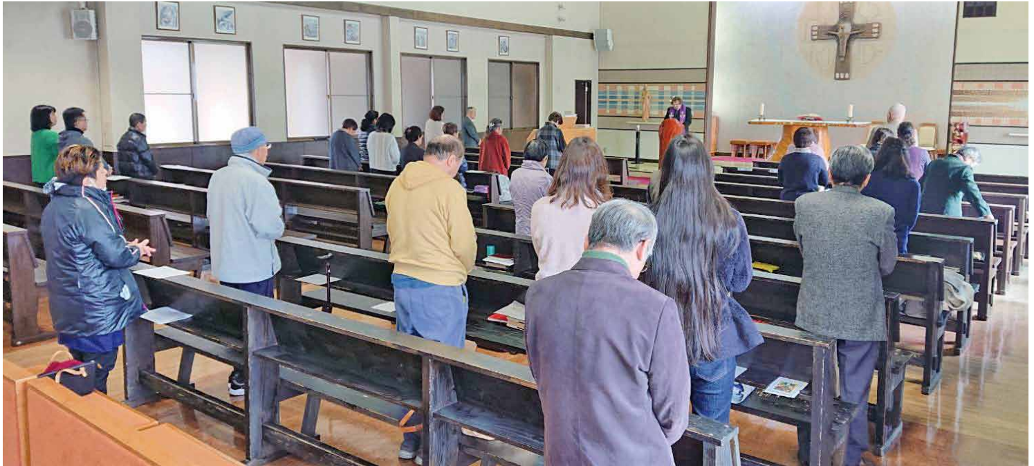
▲黙想会・講話の様子