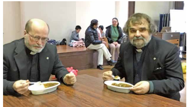
▲カレーを頬張る神父様たち